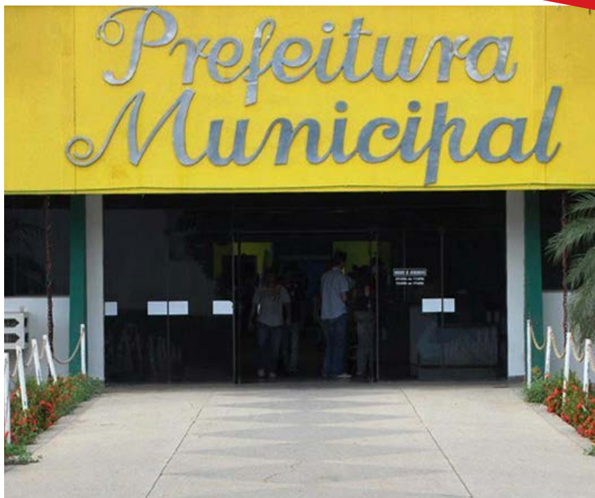
Prof. Primavera do Oeste/MT

Se o projeto fosse sancionado, os pedidos de emancipações só poderiam ser enviados às Assembleias Legislativas se estivessem de acordo com as determinações. Um deles relacionado à quantidade populacional, e só nesse quesito 45,2% dos atuais Municípios não atenderiam à determinação e não poderiam sequer chegar à fase de realização do estudo de viabilidade.