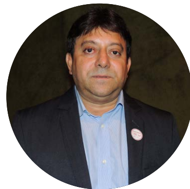
Prefeito de Poroni (PI) JOSÉ DIAS

estratégias, o governo tem alijado o Município da participação de certos tributos, de certos impostos. E isso vai diminuindo a nossa participação no bolo tributário. Então é uma luta que tem de ser estudada, tem de ser pensada e fundamentada. E nós estamos aqui para elaborar essa estratégia de luta para, pelo menos, minimizar essas dificuldades que nós estamos enfrentando.”