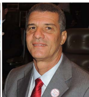
Salinas da Margarida/BA