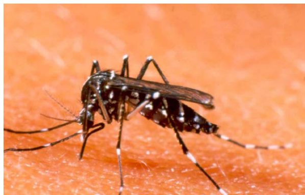
Prof. São José dos Pinhais

Como evitar? – Já que ainda não existe uma vacina para o vírus da dengue, é necessário evitar a propagação do vetor, o mosquito. O método mais simples é evitar o aparecimento de larvas