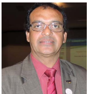
Taguaratinga do Norte/PE