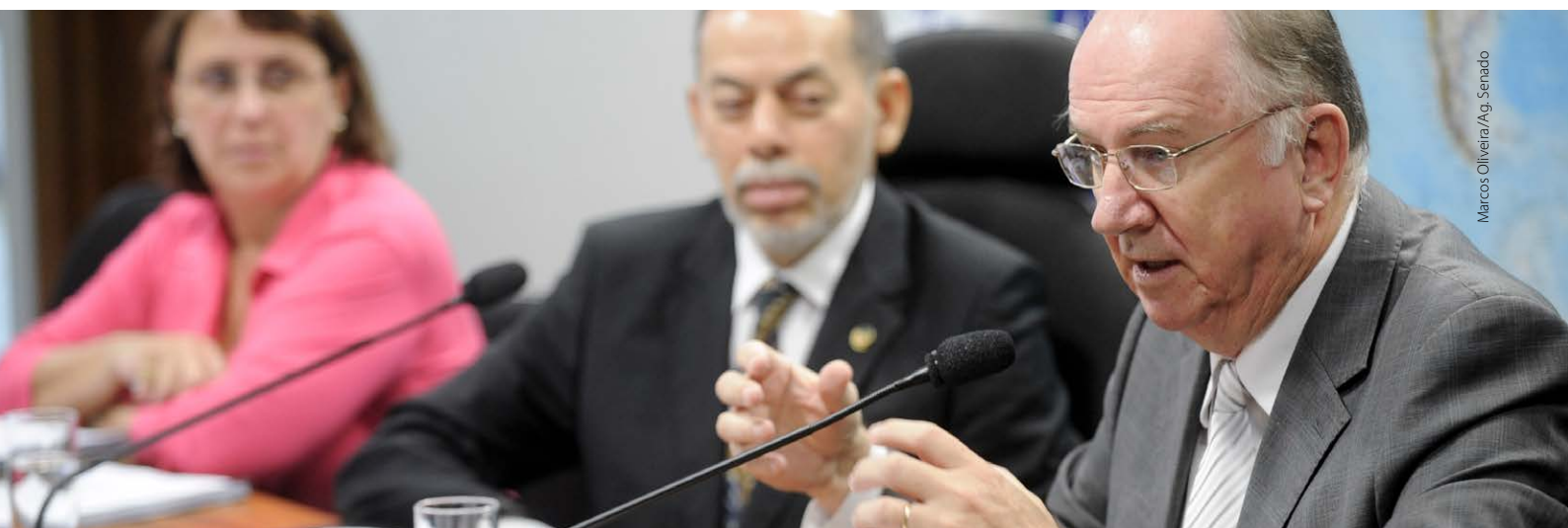
Marcos Oliveira/Ag. Senado

Da PEC 39/2012, que prevê aumento de 2% do FPM, Ziulkoski destacou que a medida representaria, em 2014, um aporte de mais de R$ 7,4 bilhões aos cofres municipais, auxiliando, sobretudo, os pequenos e médios Municípios que têm no FPM uma de suas mais importantes fontes de receitas.