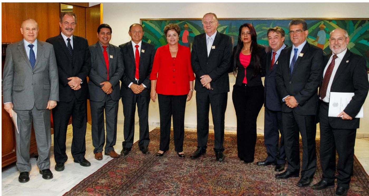
Palácio do Planalto

Não houve por parte do governo nenhuma posição de veto às propostas apresentadas.