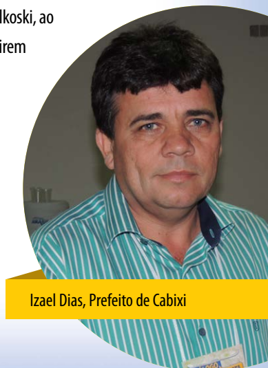
Izael Dias, Prefeito de Cabixi