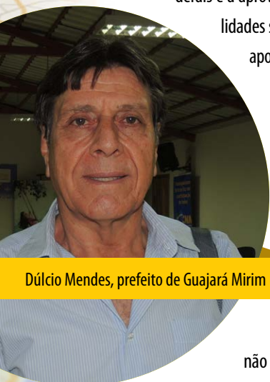
Dúlcio Mendes, prefeito de Guajará Mirim