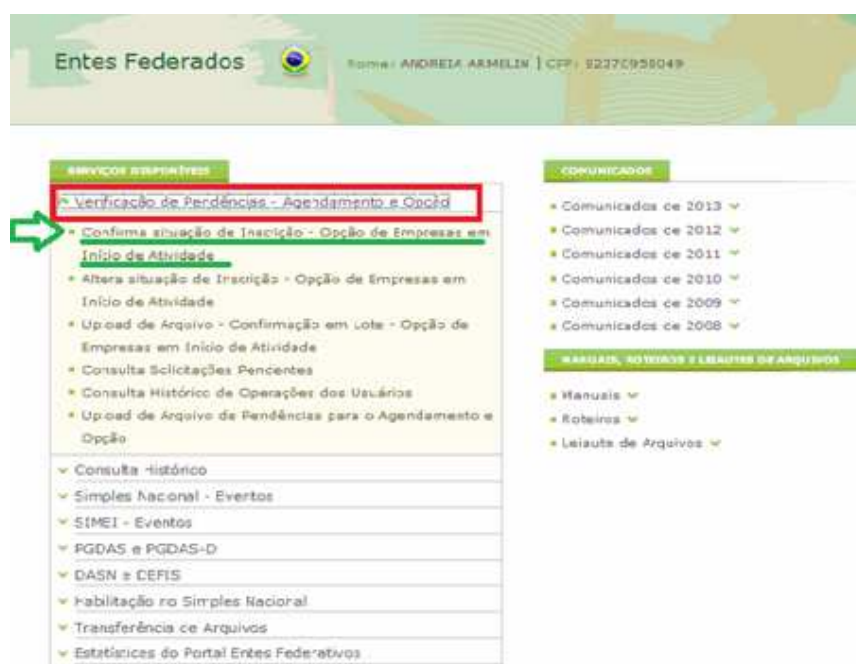
Figura 1: Portal do Simples Nacional

No entanto, após a opção pelo Simples, a Receita Federal do Brasil (RFB) disponibiliza ao Estado, ao Distrito Federal e aos Municípios a relação dos contribuintes para verificação da regularidade da inscrição municipal ou, quando exigível, da estadual. Sendo assim, esse contribuinte não passa despercebido, e o Município tem a oportunidade de exigir a regularização cadastral. Por meio da ferramenta “Confirmação da situação de inscrição – Opção de Empresas em Início de atividade” disponível no aplicativo “Verificação de Pendências – Agendamento e Opção”, o Município deve informar se o contribuinte possui ou não pendências: