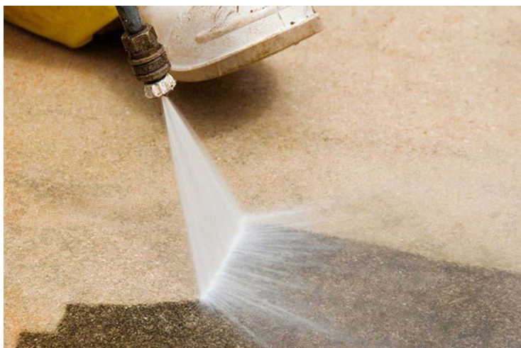
Prof. de Artur Nogueira/SP

As perdas não se restringem apenas à água. De acordo com o Instituto Trata Brasil, uma redução de apenas 10% nas perdas no país agregaria R$ 1,3 bilhão à receita operacional com a água. Esse valor é equivalente a 42% do investimento aplicado em abastecimento para todo o Brasil no ano de 2010. A redução de perdas significativas ajudaria mais as empresas a terem recursos para a expansão do atendimento em água potável e ampliação das redes de