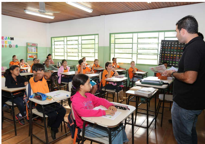
Prof. Aparecida do Taboado/MS

Apesar de ter divulgado antecipadamente o valor do reajuste, a CNM tinha expectativa de que o novo ministro da Educação, Cid Gomes, se sensibilizasse com a situação atual das prefeituras e solicitasse audiência para tratar do assunto. A reunião entre o representante do governo e o representante dos Municípios estava agendada para o dia 7 de janeiro. No entanto, tendo em vista que o ministro anunciou o valor do aumento antes do encontro, a Confederação enviou ofício ao MEC cancelando a agenda por entender que já não havia mais urgência em debater o tema.