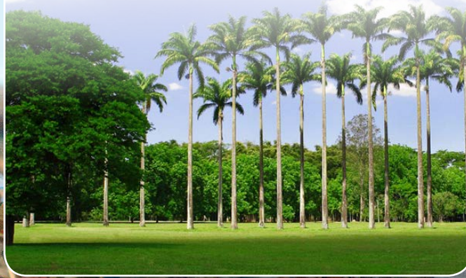
Pref. São José dos Campos/SP

Ainda de acordo com o ministro, esses motivos têm levado o STF a consagrar o reconhecimento do direito de todos à integridade do meio ambiente e a competência de todos os Entes políticos que compõem a estrutura institucional da Federação em nosso país, “com particular destaque para os Municípios, em face do que prescreve, quanto a eles, a própria Constituição da República”.