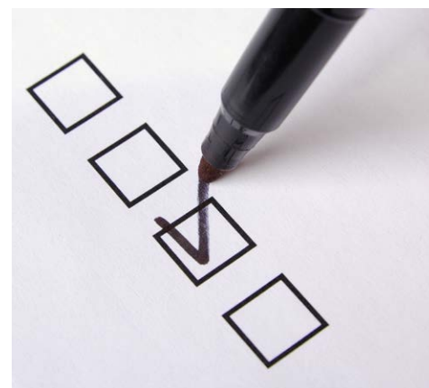
Banco de imagens

Como a Contabilidade é um ponto central para o registro dos atos da gestão municipal, a simples adoção do PCASP não garante o funcionamento normal das rotinas contábeis. Assim, a implantação dele requer a adequada customização das