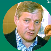
Presidente da Federação das Associações de Municípios do Rio Grande do Sul (Famurs), Seger Menegaz.

“Estamos vivendo um ano difícil de estagnação de receitas e aumento de despesas. Então essas alternativas criadas pela Marcha, como a de unir os esforços dos governadores para nos ajudarem a buscar os royalties de petróleo para os Municípios, serão importantíssimas para os Municípios. A Marcha é o fórum correto para fazer isto: mostrar as dificuldades dos Municípios. O prefeito é cobrado, mas nós não estamos tendo suporte para atender aos anseios, principalmente na área da Saúde e da Educação”.