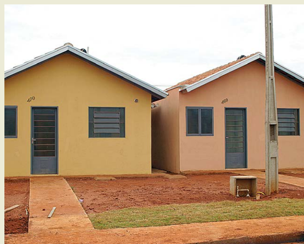
Pref. de Itaipava

A CGU identificou: problemas construtivos e da não entrega de serviços contratados e pagos, como reboco, pintura, forro, vidros, entre outros; ocorrência de atrasos nas obras; atraso do governo em repassar os recursos; trabalho informal na maioria das obras (trabalhadores sem registro e sem equipamentos de proteção); risco patrimonial do governo ao antecipar recursos a instituições e agentes financeiros sem qualquer garantia. Vide quebra do Banco Morada; ganhos financeiros in-