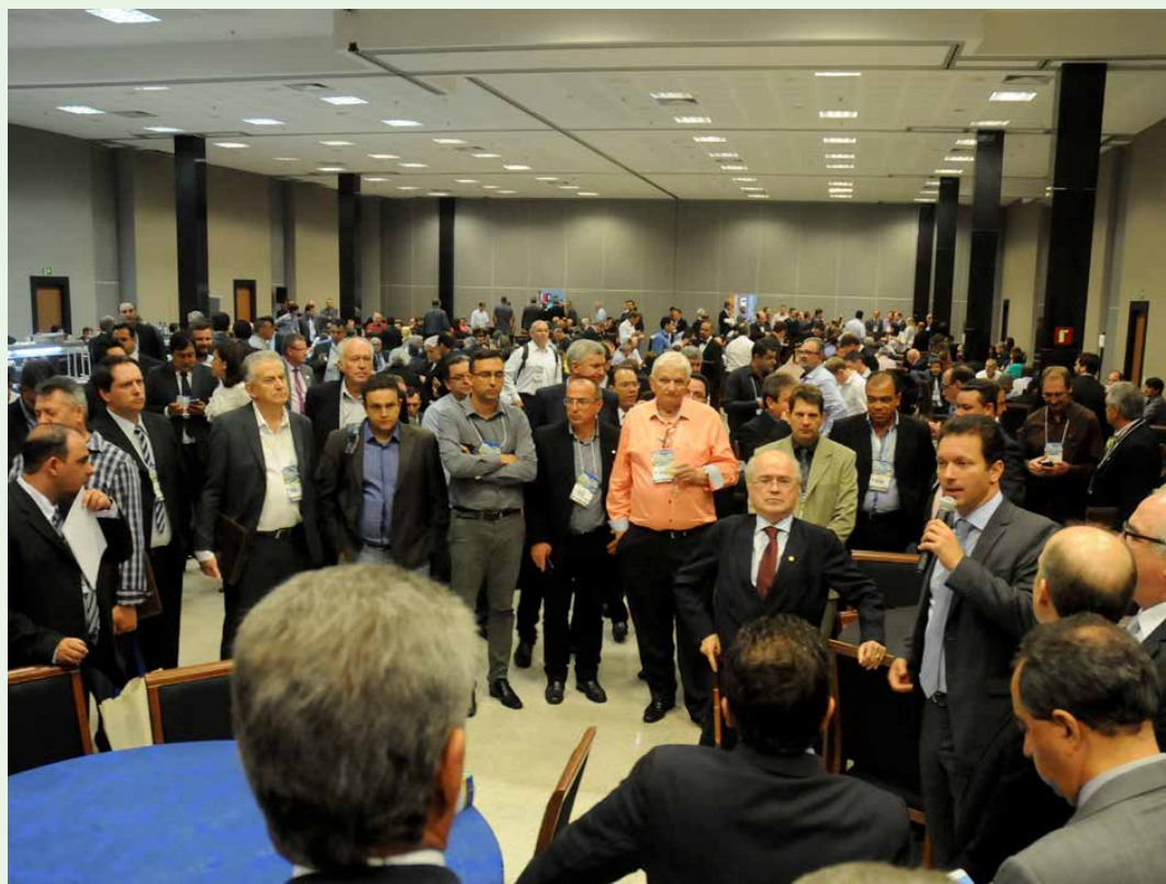
Parlamentares reafirmaram compromisso de lutar para que a pauta municipalista avance no Congresso

“O Congresso Nacional pode e deve trabalhar em benefício do municipalismo, porque nós devemos defender o Município. Por isso, eu sou a favor