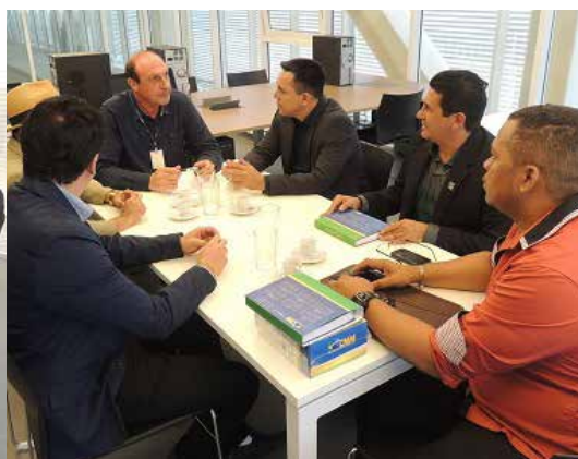
Prefeito de Vitória do Jari (AP), Raimundo Souza