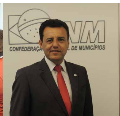
Prefeito eleito de Sanclerlândia (GO), em Goiás, Itamar Leão