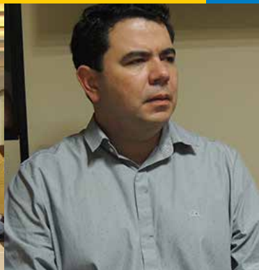
Prefeito eleito de Balsas (MA), Erick Silva