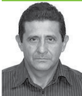
Prefeito de Tartarugalzinho (AP), Rildo Gomes de Oliveira