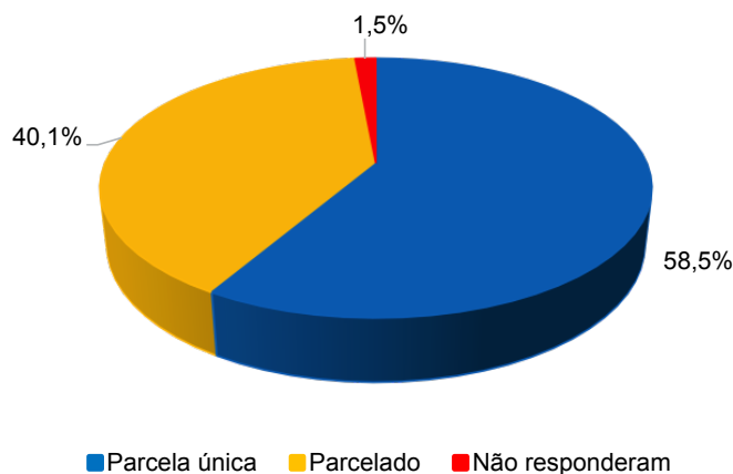
Gráfico 5 – A forma de pagamento do 13º salário

De modo geral, a CNM observou uma tendência de postergação do pagamento do 13º salário, pois o percentual de Municípios que optaram em pagar em parcela única caiu frente aos últimos anos. Em 2016, 3.304 Municípios optaram por pagar a gratificação de uma única vez, sendo que, em 2010, por exemplo, 3.521 Municípios pagaram em uma única parcela. De acordo com a Confederação, tais números evidenciam uma necessidade de maior prazo para os gestores municipais buscarem recursos e evitarem atrasos em pagamentos de folha de pessoal.