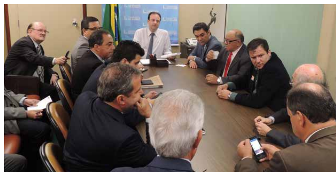
CNM apresenta pauta prioritária ao líder do governo na Câmara dos Deputados, o deputado André Moura (PSC-SE), dentre elas: uma medida que promova a partilha à multa da repatriação com os Municípios.

Porém, contrariando todas as expectativas dos prefeitos, após a aprovação da matéria pelo Congresso, a presidente Dilma vetou o artigo que previa a partilha da multa com os governos estaduais e municipais, retirando deles a metade dos recursos para aumentar a arrecadação do governo. Todo esse processo ocorreu em meio a um atípico cenário político, que culminou na perda do mandato da presidente petista e na posse constitucional de seu vice-presidente, o peemedebista Michel Temer. A mudança do governo federal trouxe consigo uma inversão automática no apoio à pauta dos Municípios.