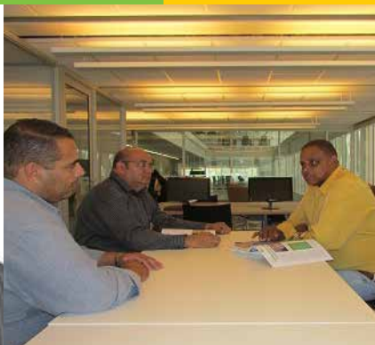
Prefeito de Sabino (SP), Pedro de Paulo