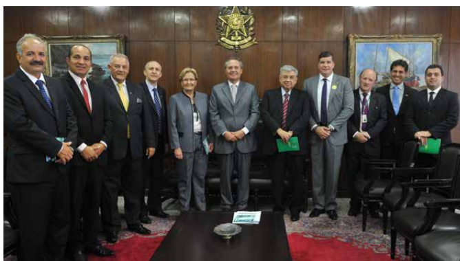
Diretoria da CNM solicita ao presidente do Senado, Renan Calheiros (PMDB-AL), e a outros senadores a votação de pautas municipalistas, inclusive PL que partilha recursos das multas de repatriação com as Prefeituras.