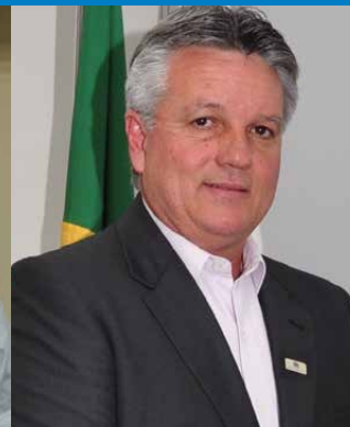
Prefeito de Brodowski (SP), Elves Carreira