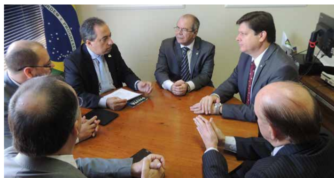
Representantes da CNM foram recebidos pelo líder do PMDB na Câmara dos Deputados, Baleia Rossi, e pelos deputados Hildo Rocha (PMDB-MA) e Mauro Pereira (PMDB-RS). Apoio à realização da semana municipalista de votação e distribuição dos recursos da multa da repatriação com os governos locais estavam na pauta.