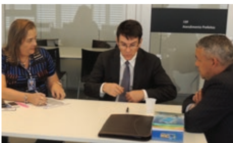
Prefeito de Armação dos Búzios/RJ