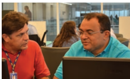
Vice-Prefeito de Felipe Guerra/RN