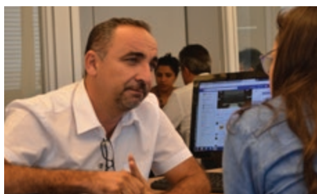
Prefeito de Petrolândia/PE