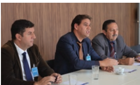
Prefeitos de São Paulo