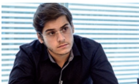
Prefeito de Santa Maria/RN