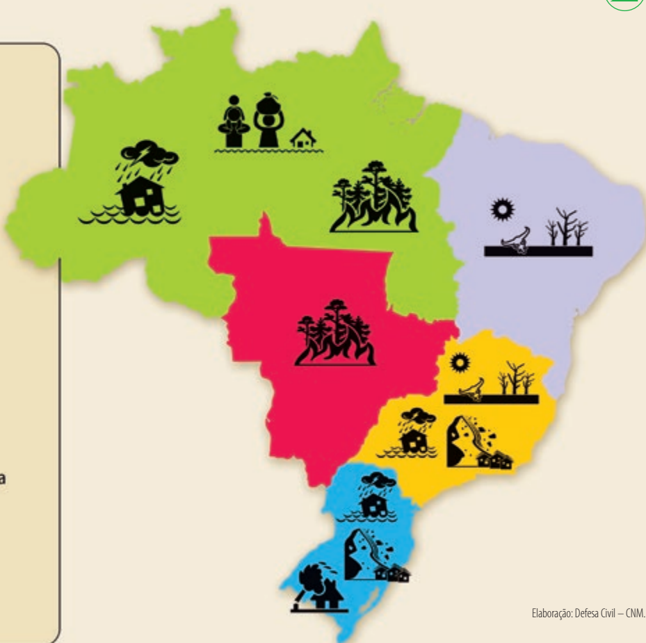
Elaboração: Defesa Civil – CNM.