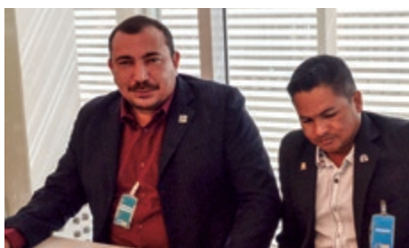
Prefeito de Iracema/RR