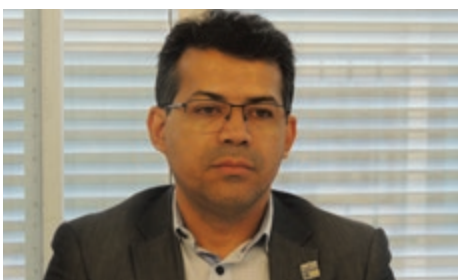
Prefeito de Lagoa Nova/RN