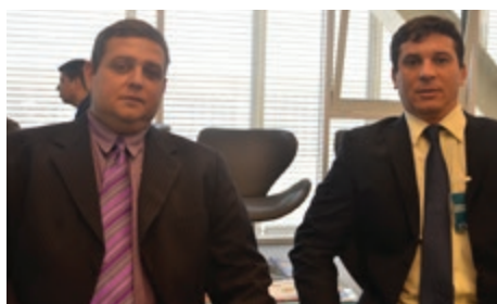
Prefeito e Vice de Porciúncula/RJ