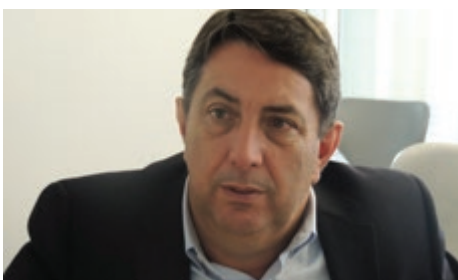
Prefeito de Valentim Gentil/SP