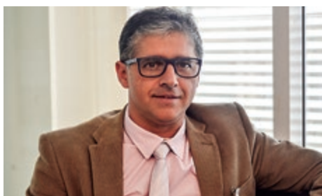
Prefeito de Inhapim/MG