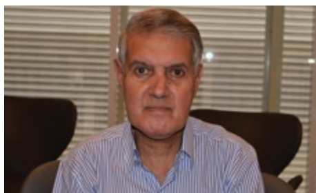
Prefeito de Coronel Pacheco/MG