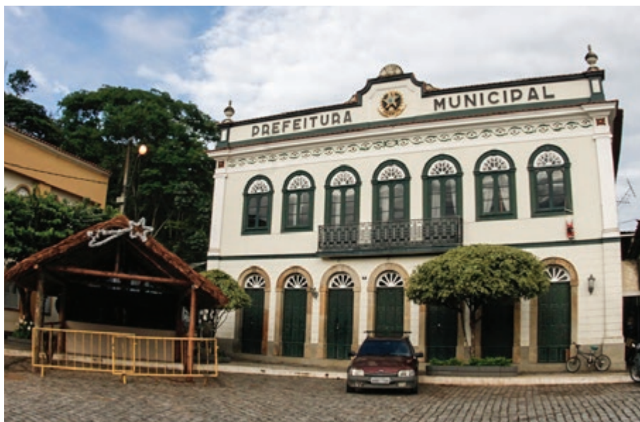
Prof. Duas Barras/MG

Essa situação faz com que a CNM ressalte a importância de os gestores locais realizarem planejamentos financeiros cautelosos e que procurem ma-