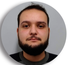
Aquila Estudos Técnicos POA