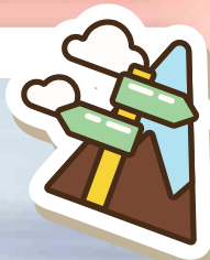
Atacama - Chile