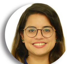
Inayara Projeto Clima BSB