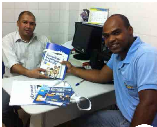
Visita a Município