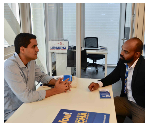
Atendimento na CNM