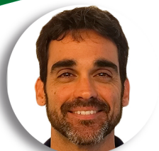
Marcus Vinicius Contabilidade BSB