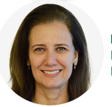
Elisiane Estudos Técnicos BSB