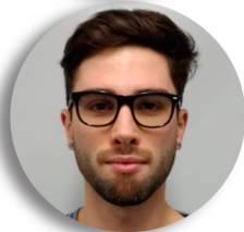
Gabriel Estudos Técnicos POA