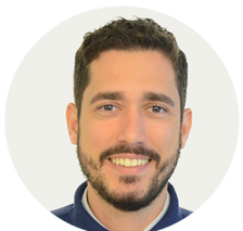
Luiz Philipe Comunicação BSB