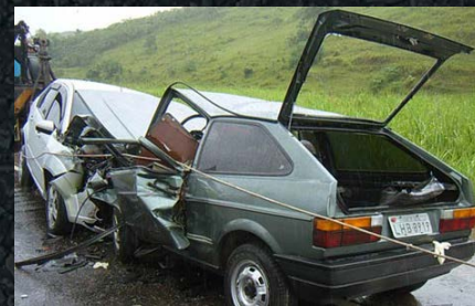
Secret. Saúde/Gov. Alagoas

Ainda em setembro, uma portaria que prevê recursos para promover ações que reduzam mortes por acidentes e violência no trânsito foi publicada