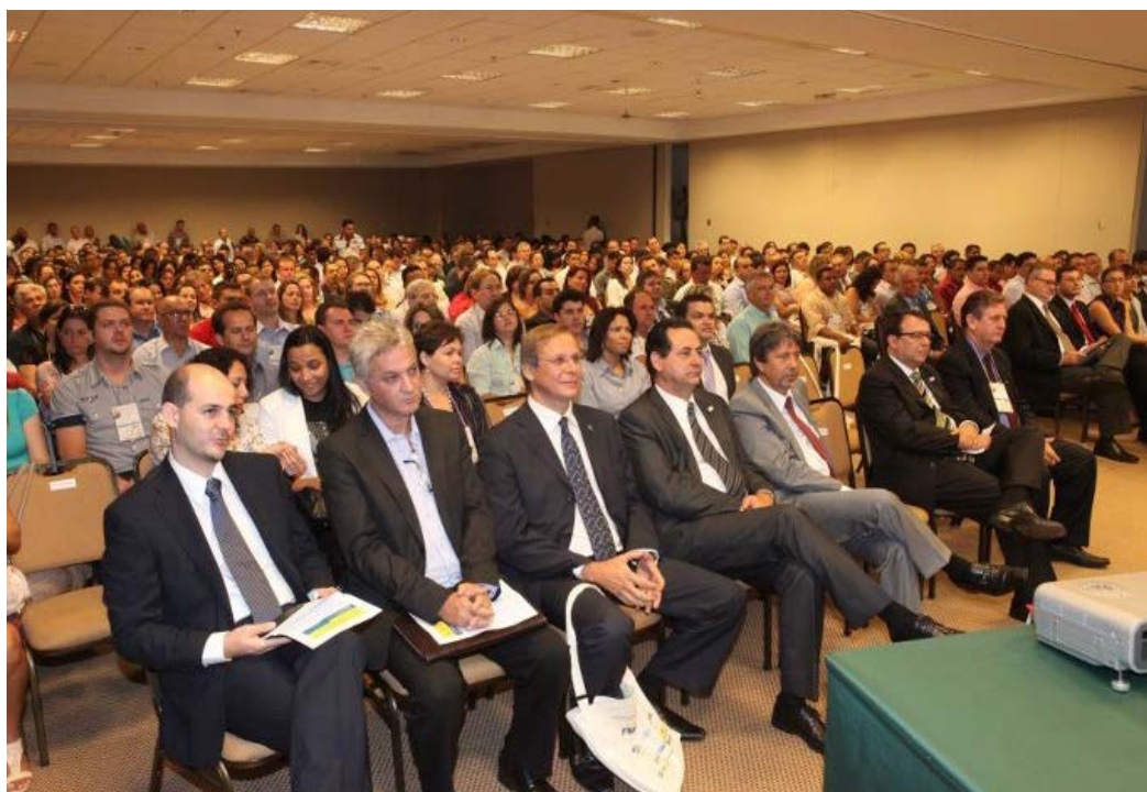
Agência Sebrae de Notícias