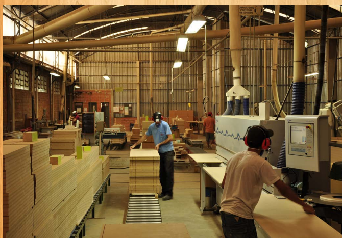
Pref. de Chapecó