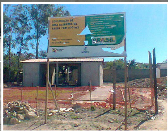
Pref. de Araripe/CE