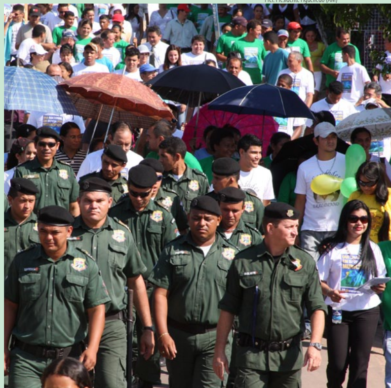
Prof. Presidente Figueiredo (AM)

Como o PLP está parado na Câmara há mais de um ano, o alvo da mobilização foram os deputados federais. “A Saúde do Brasil não pode esperar.