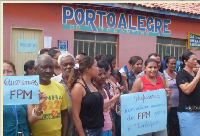
Prefeitura de Porto Alegre/TO

No Novos Gestores, prefeitos têm a oportunidade de entender melhor temas como Saúde, Educação, Previdência, Cultura e Jurídico