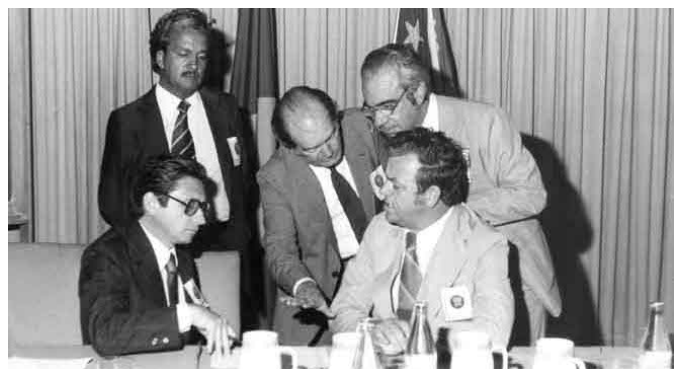
Jornal Eco do Vale

De acordo com relatos de Nagib, o primeiro passo foi estruturar uma entidade estadual. Assim, em maio de 1976, foi constituída a Federação das Associações do Rio Grande do Sul (Famurs). Em seguida, Nagib entrou em contato com as entidades de outros Estados para discutir a ideia com outros gestores. Prefeitos dos Estados de São Paulo, Rio de Janeiro, Goiás e Santa Catarina, junto à recém-criada Famurs, deram o primeiro passo para instituírem a CNM.