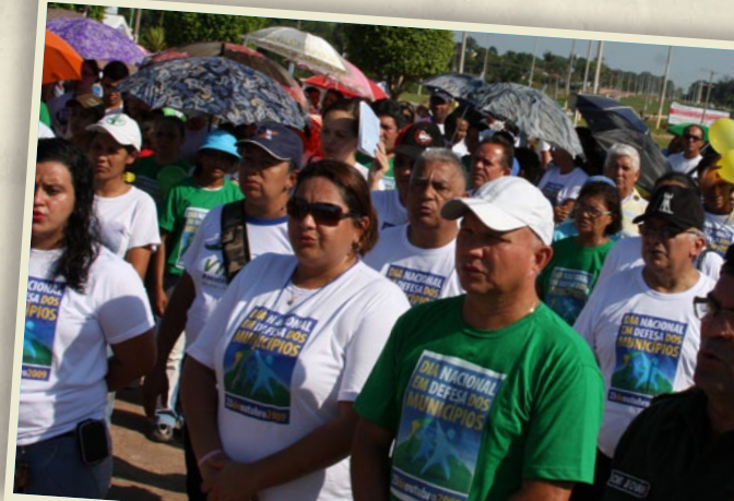
Pref. Presidente Figueiredo/AM

A população de Porto Alegre do Tocantins, por exemplo, apoiou a mobilização do Dia 23 de outubro. Um fato inédito para os Municípios que participaram