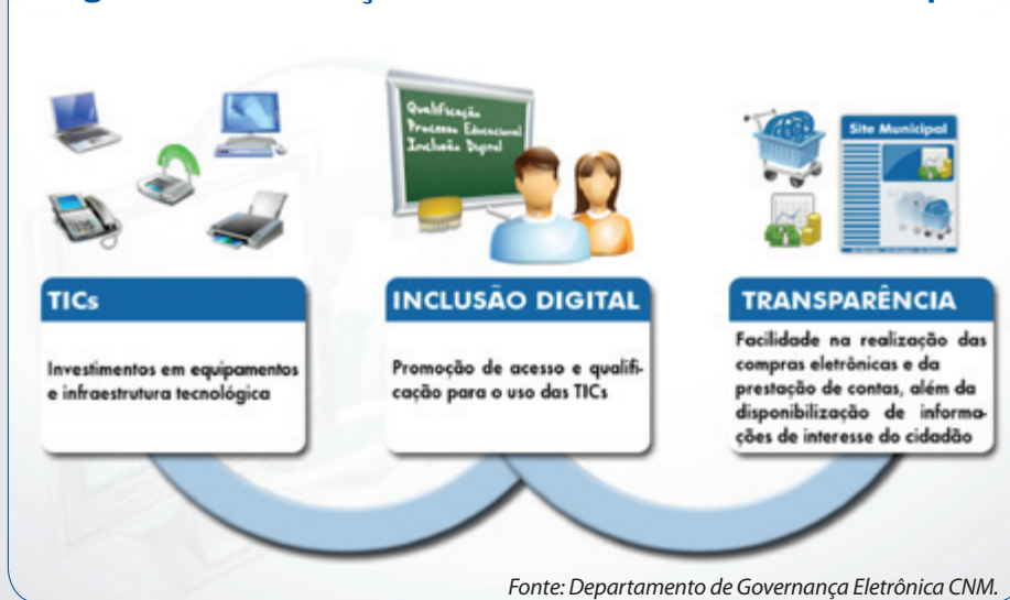
Figura 2 – Estruturação do Governo Eletrônico no Município