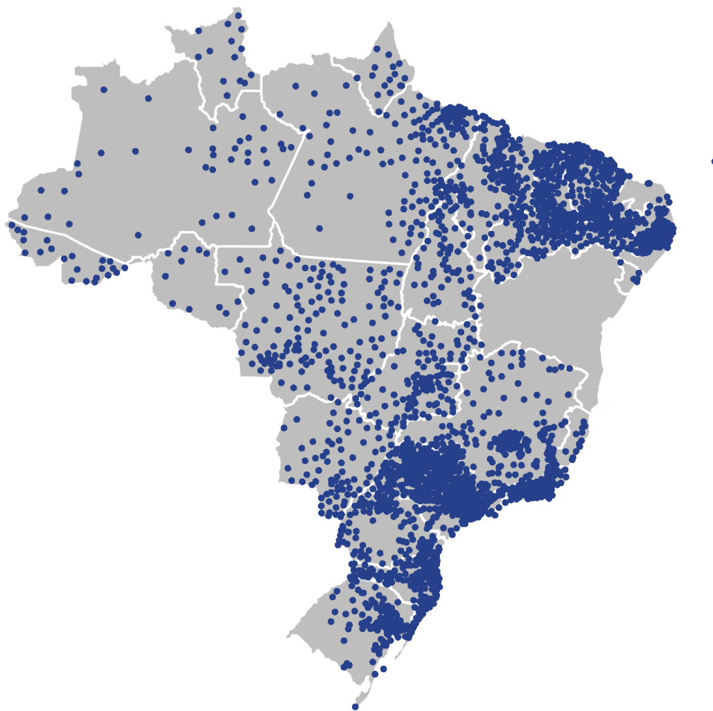
Figura 1 – Municípios que tiveram aumento de população em 2018.