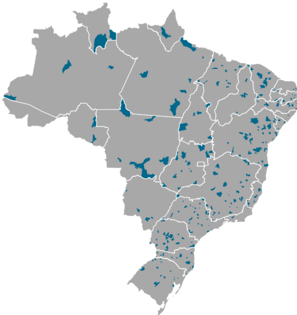
Figura 3 – Municípios que não mudam o coeficiente – (diferença de até 500 habitantes)