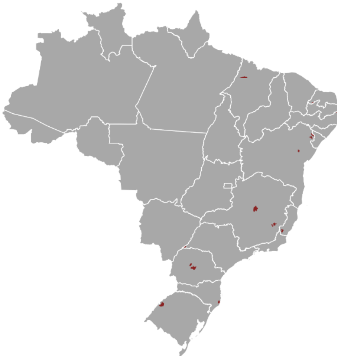
Figura 1 – Municípios que teriam coeficiente do FPM reduzido